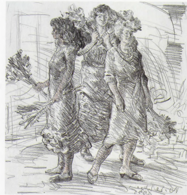
ÇİÇEKÇİLER VII, Desen-K.Kalem, 1995, 24x23 cm.