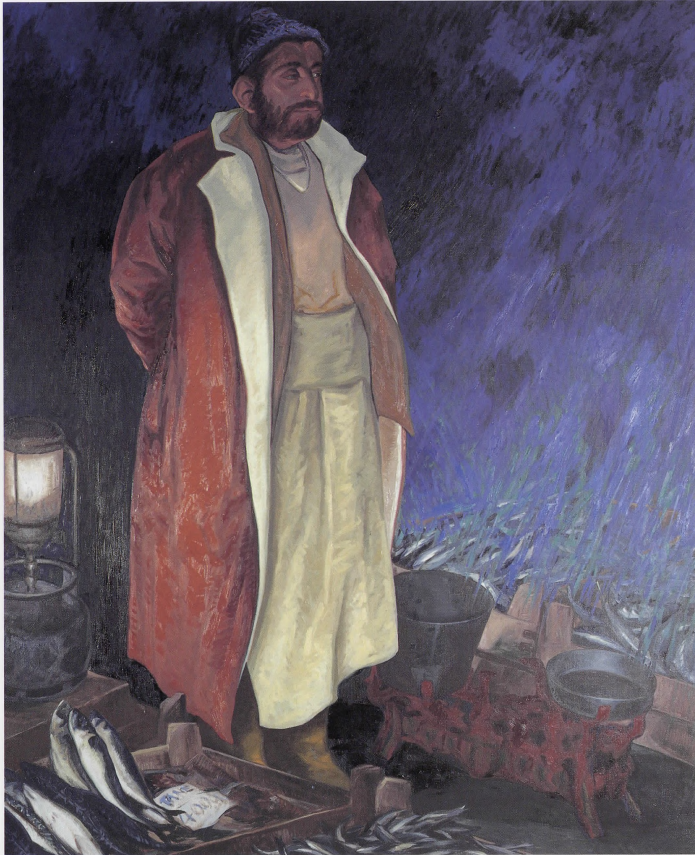
KARAKÖY'DE BALIKÇILAR II, Tuv./Yğb. 1994, 180x150 cm.