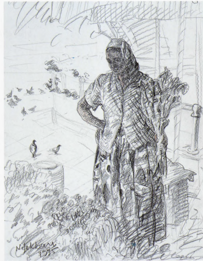
ÇİÇEKÇİLER II, Desen-K.Kalem, 1995, 32x24 cm.