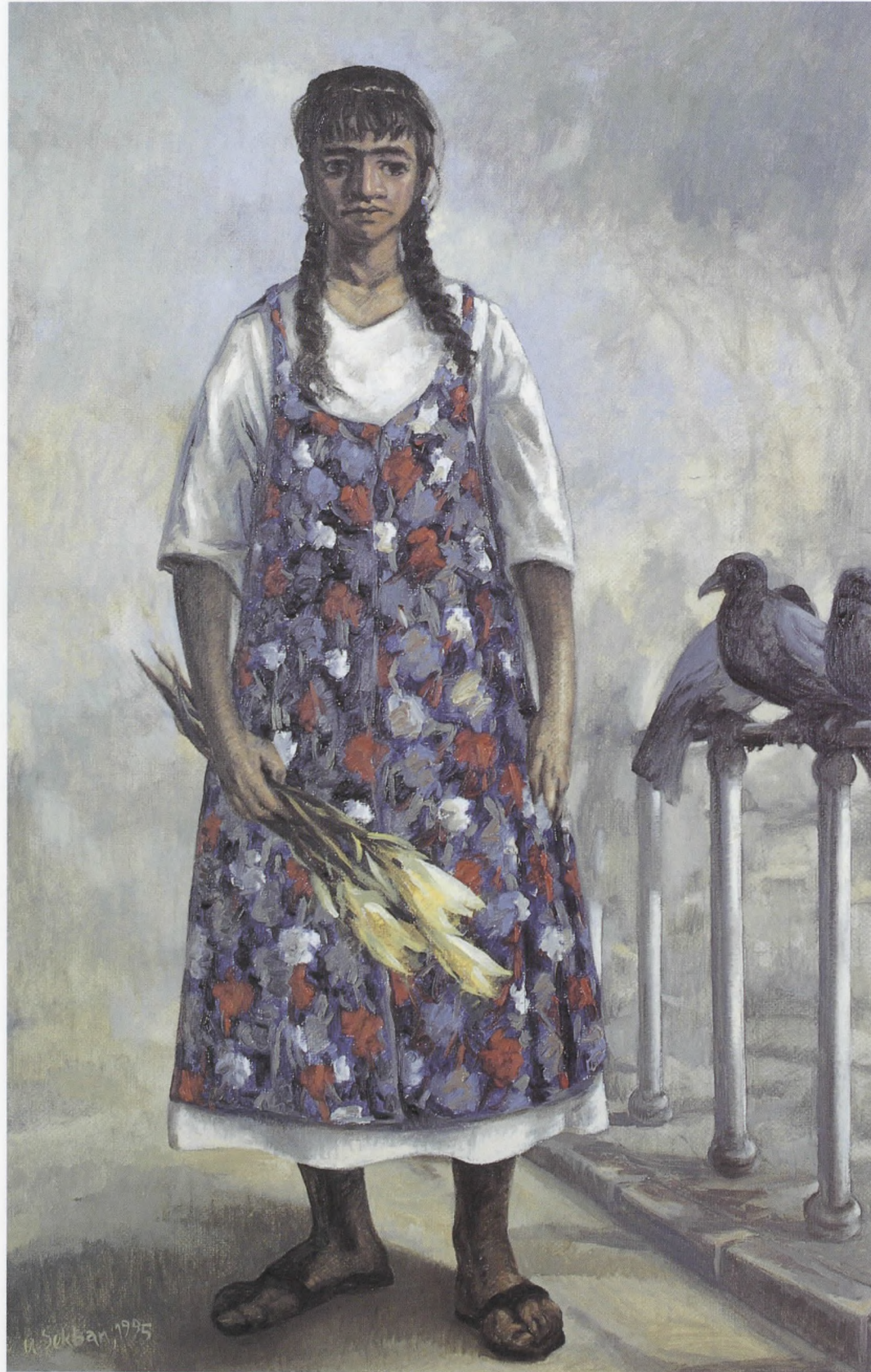
ÇİÇEKÇİLER IV, Tuv./Ygb. 1995, 87x57 cm.