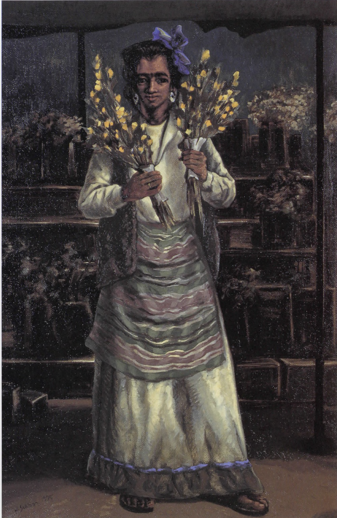
ÇİÇEKÇİLER I, Tuv./Yğb. 1995, 87x57 cm.