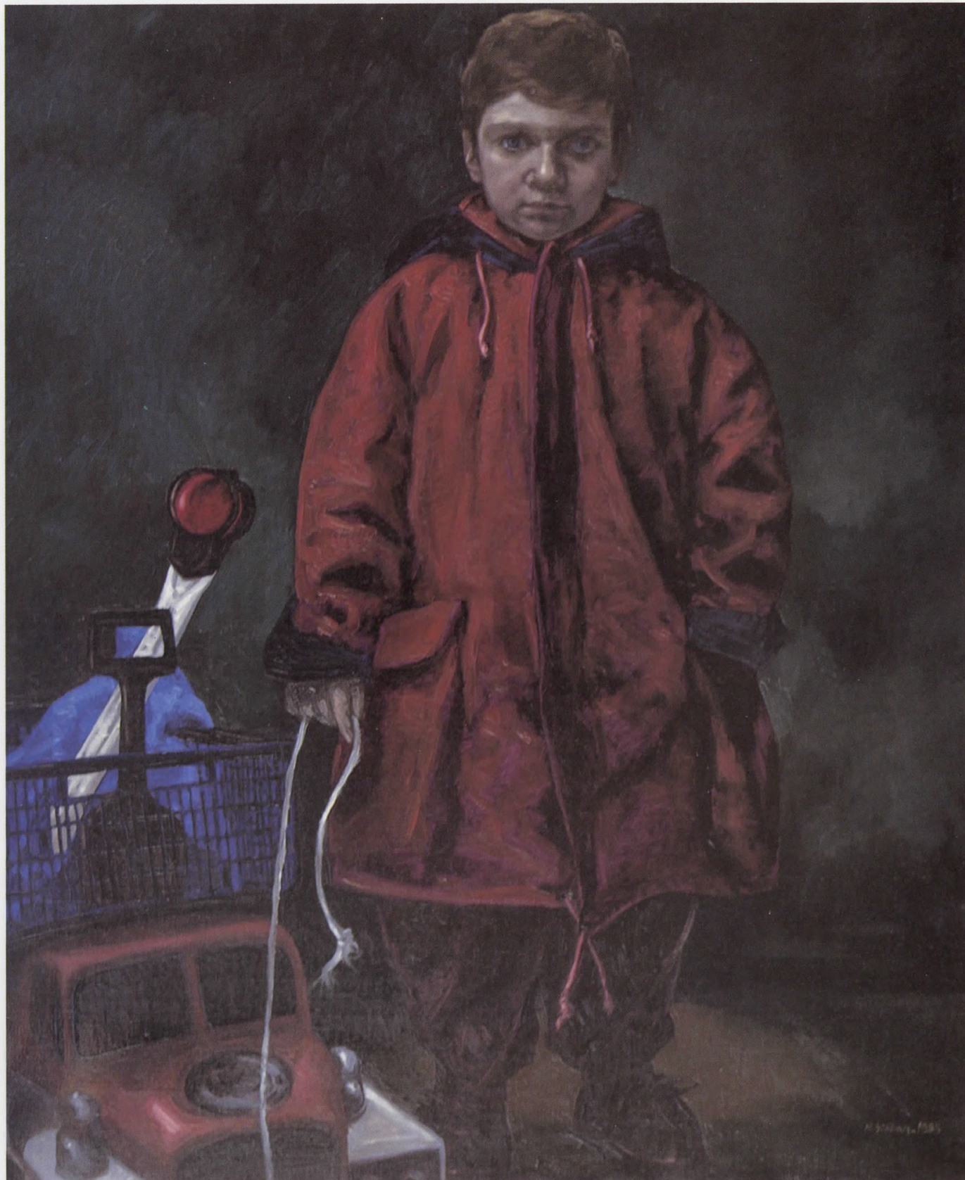
CAN, Tuv./Yğb. 1994, 120x100 cm.