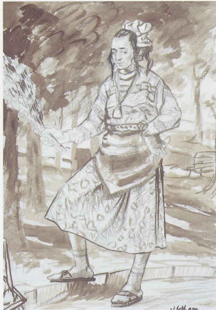
ÇİÇEKÇİLER III, Desen-K.Kalem 1995, 56.5x38 cm.