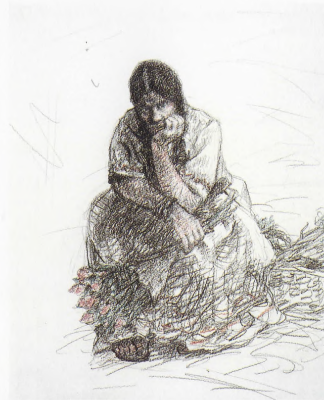
ÇİÇEKÇİLER IX, Desen-K.Kalem, 1995, 38x29 cm.