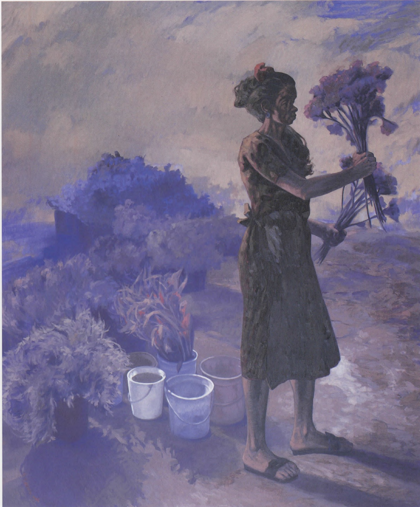
ÇİÇEKÇİLER V, Tuv./Yğb. 1995, 180x150 cm.