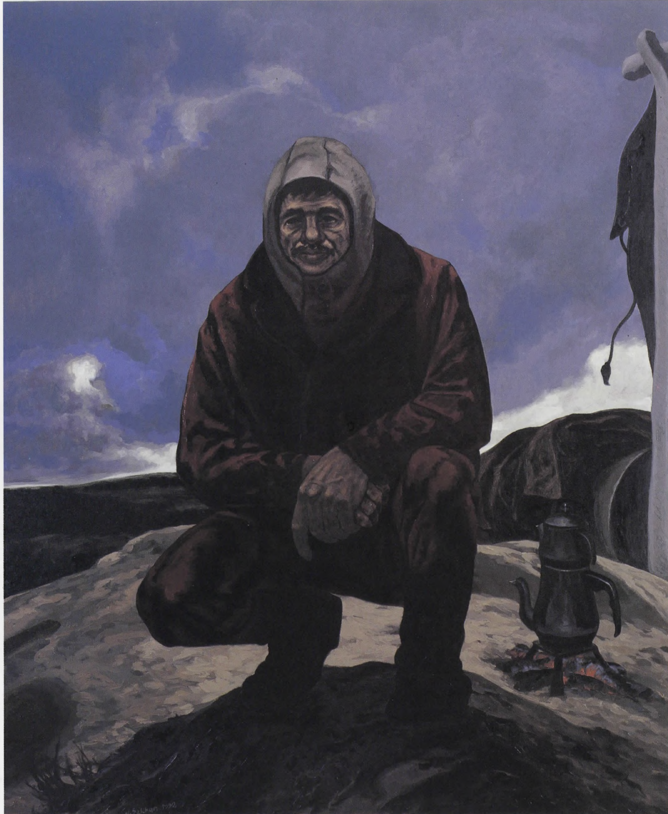
DEMİRYOLU-MOLA II, Tuv./Yğb. 1992, 180x150 cm.