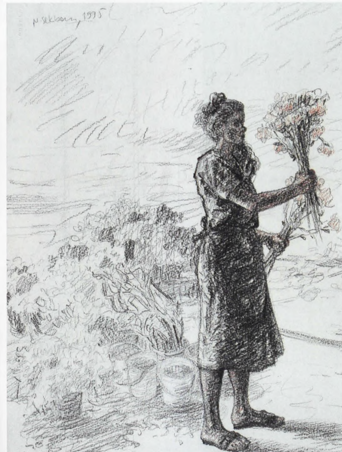
ÇİÇEKÇİLER V, Desen-K.Kalem, 1995, 38.5x28.5 cm.