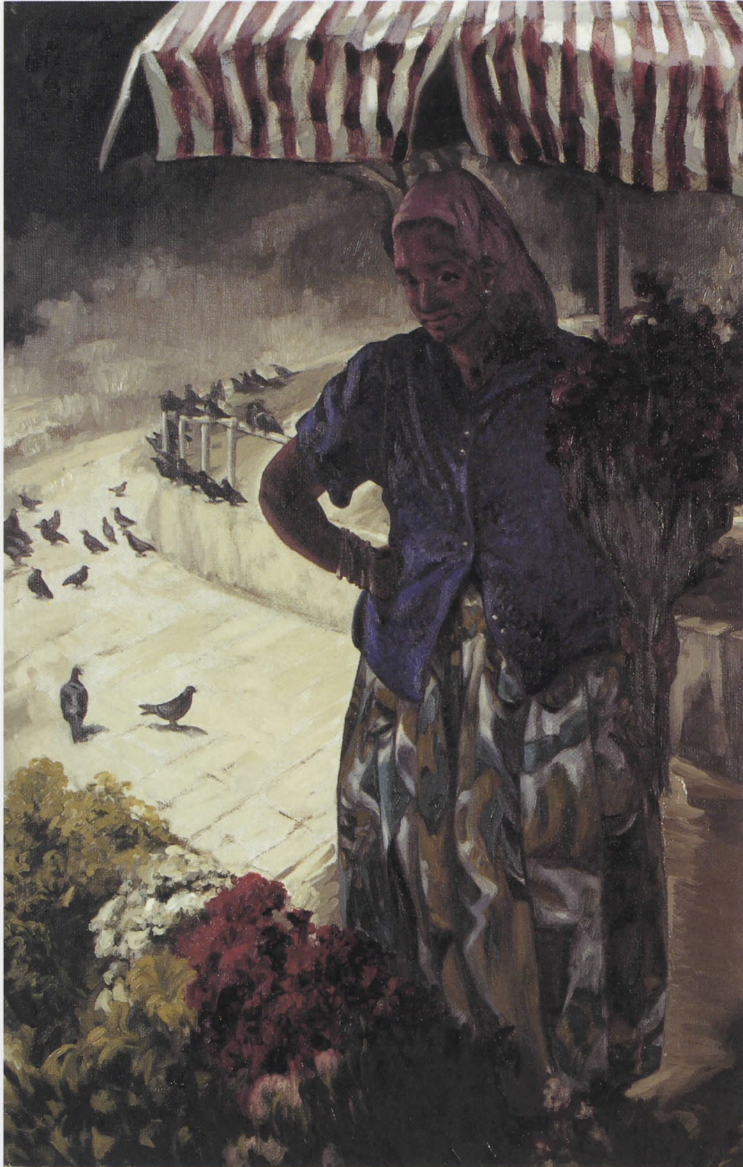
ÇİÇEKÇİLER II, Tuv./Yğb. 1995, 87x57 cm.