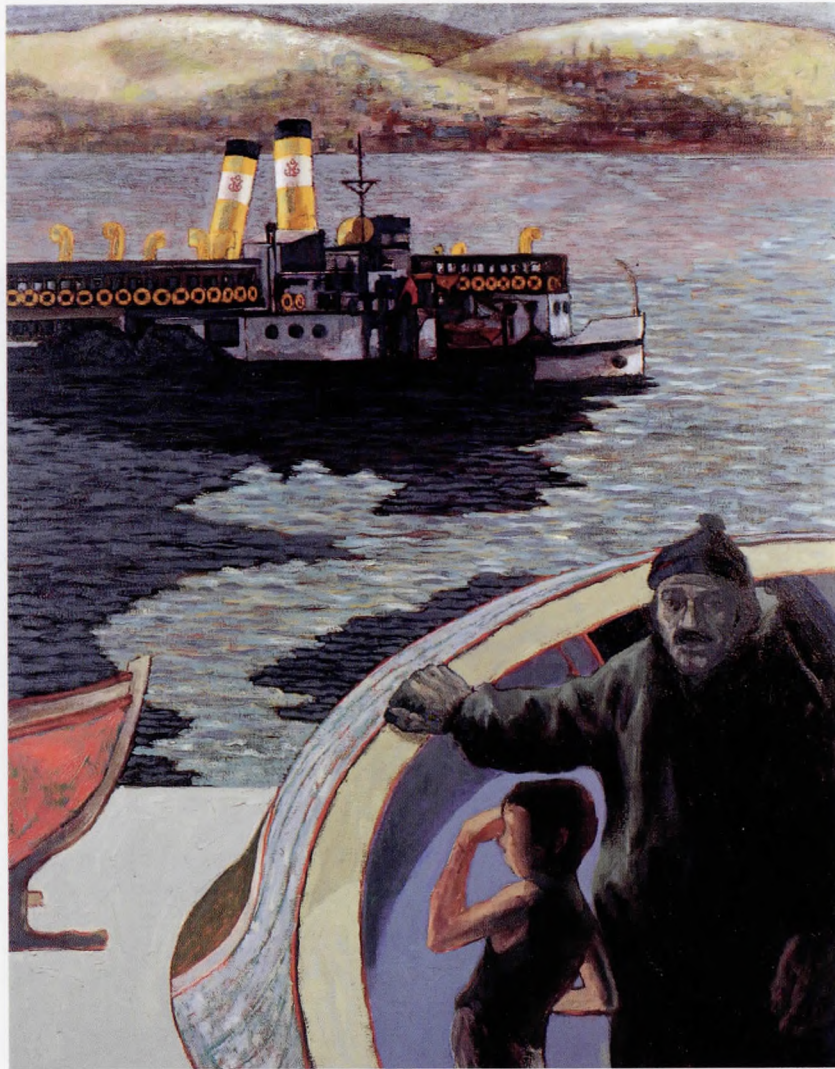
Kömür dubası II. Tuval üzerine yağlı boya 110x87