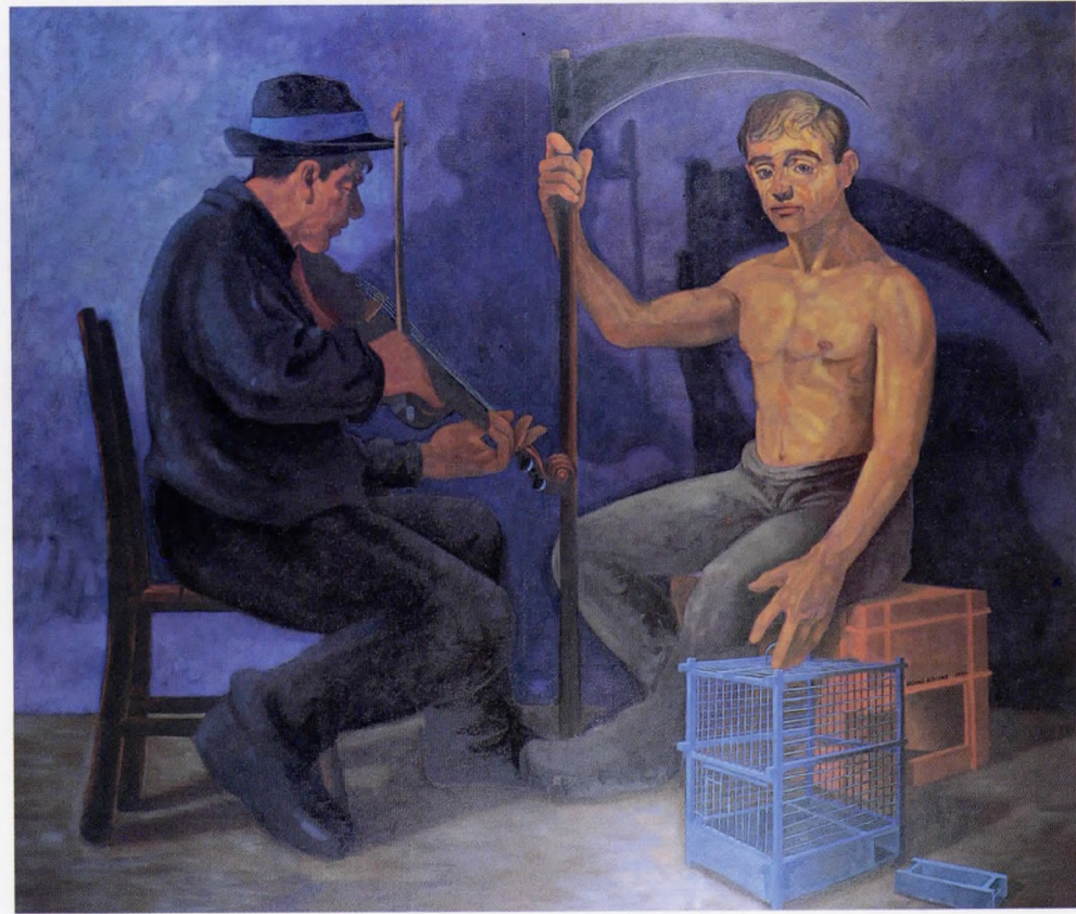
Söyleşi 1990 Tuval üzerine yağlı boya 180x150 cm.