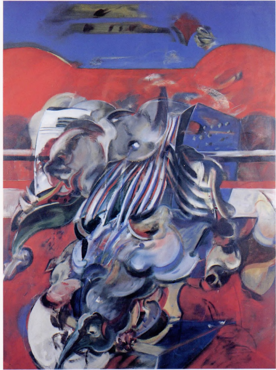
Açık alanda devingen Tuval üzerine yağlı boya 138x100 cm.