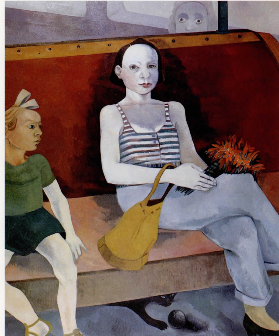
Vapurdaki kız 1990 Tuval üzerine yağlı boya 180x160 cm