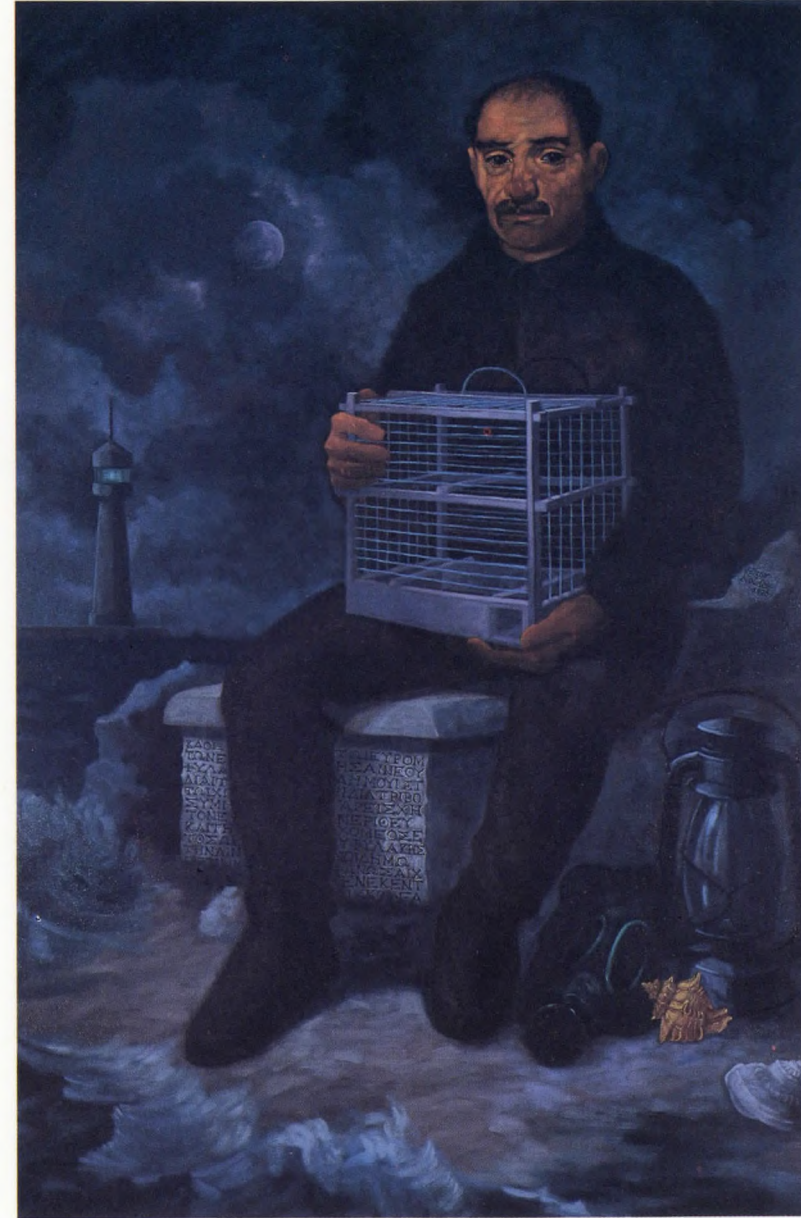
Fenerci II 1990 Tuval üzerine yağlı boya 150x120 cm.

1973 Devlet Resim Heykel Sergisi Ankara 1975 Ahmet Andicen yarışması sergisi 1976 Yarımca Festivali İzmit 1976 DYO 10. Resim sergisi İstanbul 1976 Görsel Sanatlar Galerisi 1978 DYO 11. Resim Sergisi İstanbul 1978 Kartal Belediyesi Kültür ve Sanat Şenliği İstanbul 1978 Galata Sanat Galerisi İstanbul 1979 Yeni Eğilimler İstanbul 1984 Pangaltı Sanat Galerisi İstanbul 1984 45. Devlet Resim ve Heykel Sergisi Ankara 1986 Teşvikiye Sanat Galerisi İstanbul 1987 Tanbay Sanat Galerisi Ankara 1988 Kayaalp Sanat Galerisi, Grup Sergisi İstanbul 1989 Destek Sanat Galerisi Öğr. Üyeleri Karma Sergisi İstanbul 1989 Yapı Kredi Kazım Taşkent Sanat Galerisi "Türk Resmin de Ortak Bilinc" karma sergisi İstanbul 1989 Urart Sanat Galerisi, Grup Sergisi İstanbul 1989 Sanfa Sanat Galerisi, Grup Sergisi İstanbul 1990 Urart Sanat Galerisi, Ankara 1990 Medusa Sanat Galerisi Karma Sergisi 1990 Kadıköy Kültür ve Sanat Galerisi, Öğr. Üyeleri Karma Sergisi İstanbul 1990 Vakıf Bank Galerisi, Tekel 4. Resim yarışma sonuçları sergisi İstanbul