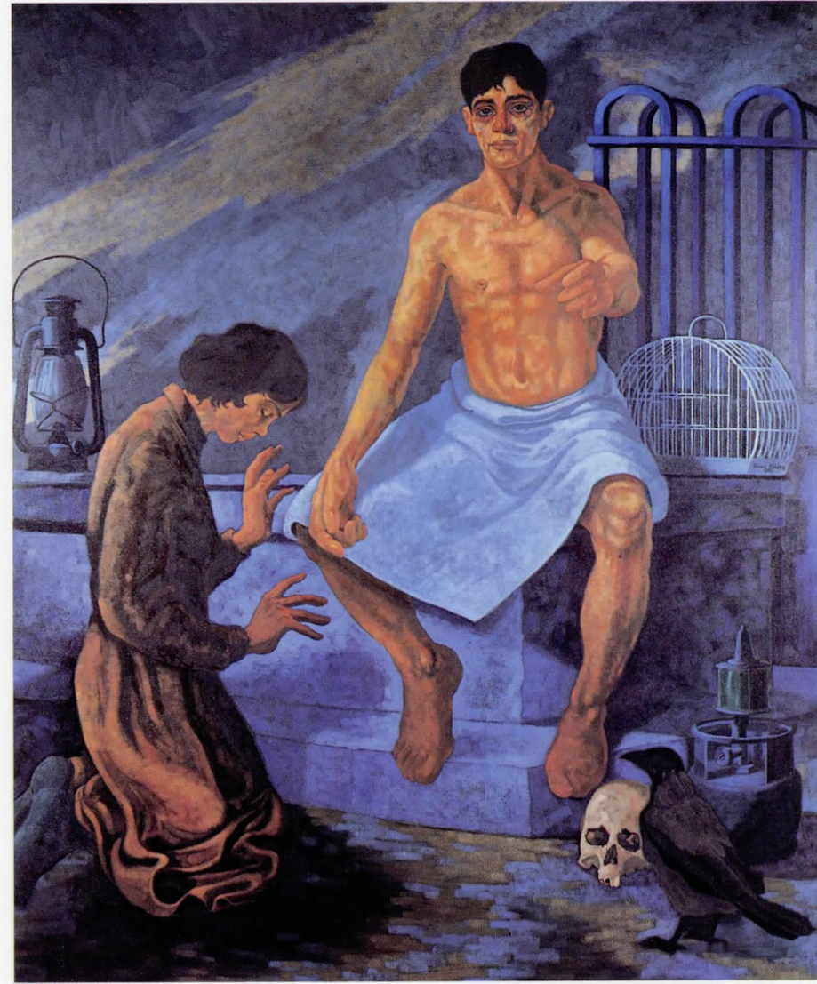
Söyleşi II 1990 Tuval üzerine yağlı boya 180x150 cm.