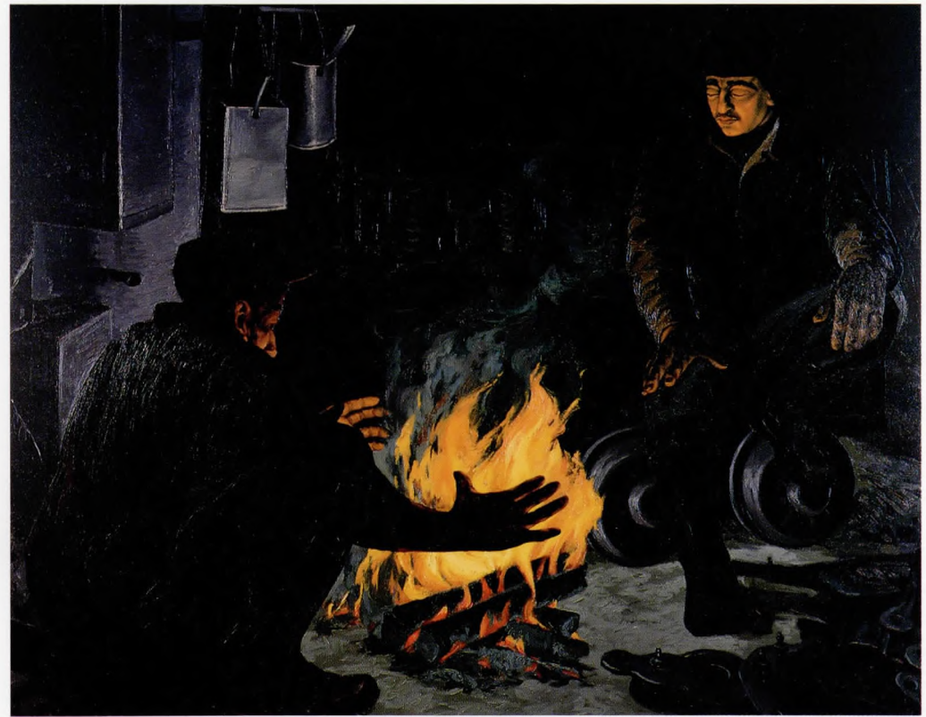
Kanal işçileri ateş başında 1990 Tuval Üzerine yağlı boya 146x184 cm.