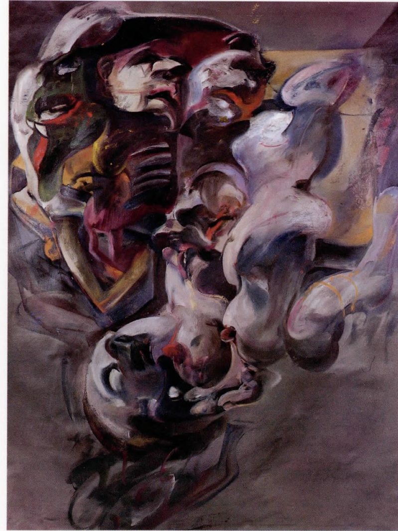
Dönüşüm Tuval üzerine yağlı boya 138x160 cm

1971 Ahmet Andıçen Resim Yarışması 1.lik ödülü 1971 Can İren Resim Yarışması 1.lik ödülü 1972 Ahmet Andıçen Resim Yarışması 2.lik ödülü 1979 DYO 25. Yıl, 13. Resim Sergisi, Başarı ödülü 1979 2. İstanbul Sanat Bayramı, Yeni Eğilimler Sergisi Başarı Ödülü