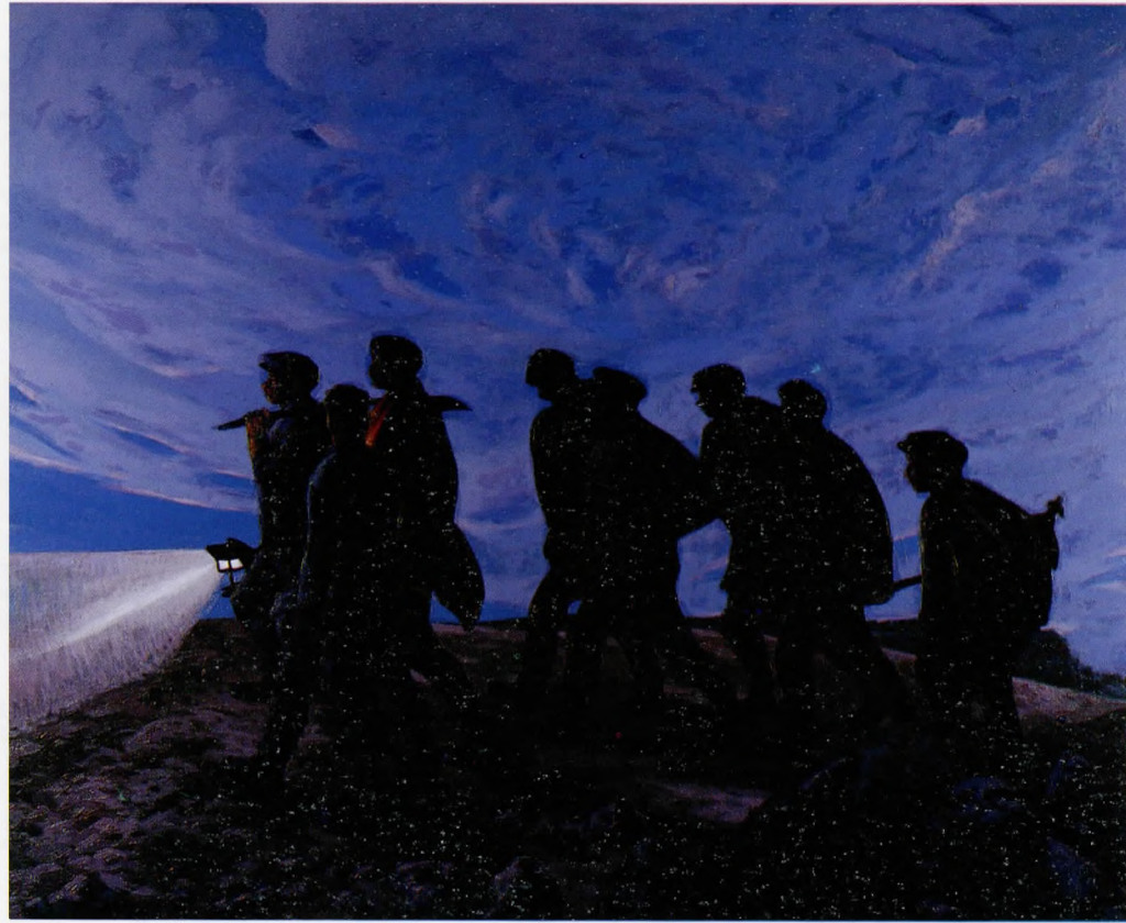
Yol gösteren pürmüz feneri 1990 Tuval üzerine yağlı boya 146x184 cm.