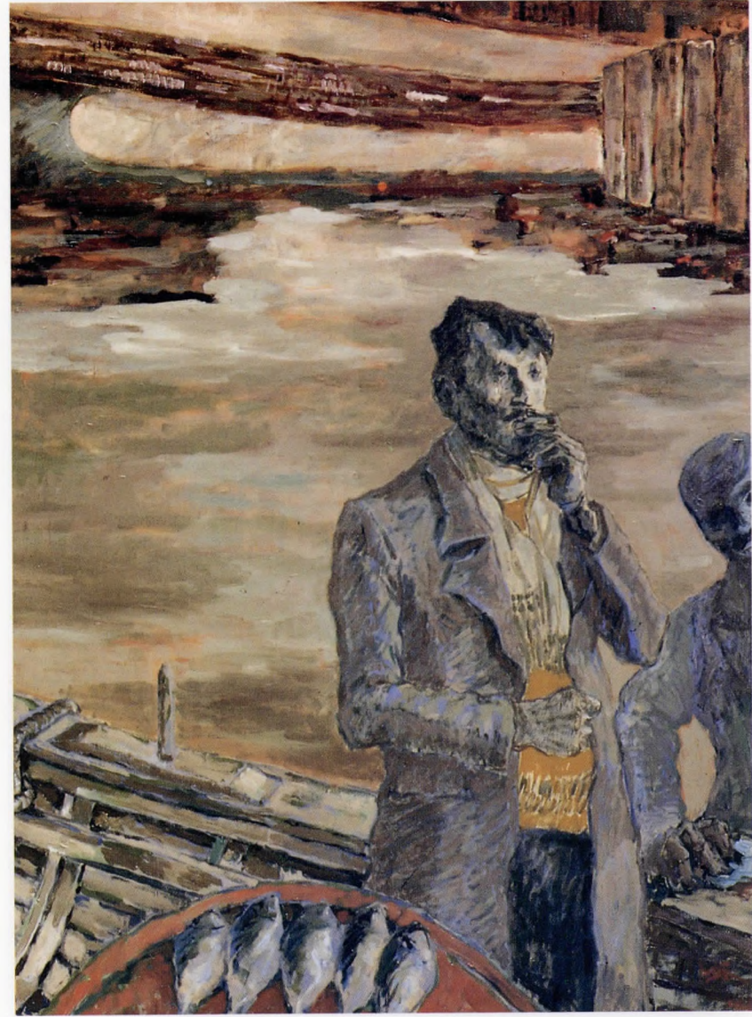
Venedik kırmızısından Haliç'e 1985 Tuval üzerine yağlı boya 90x110 cm