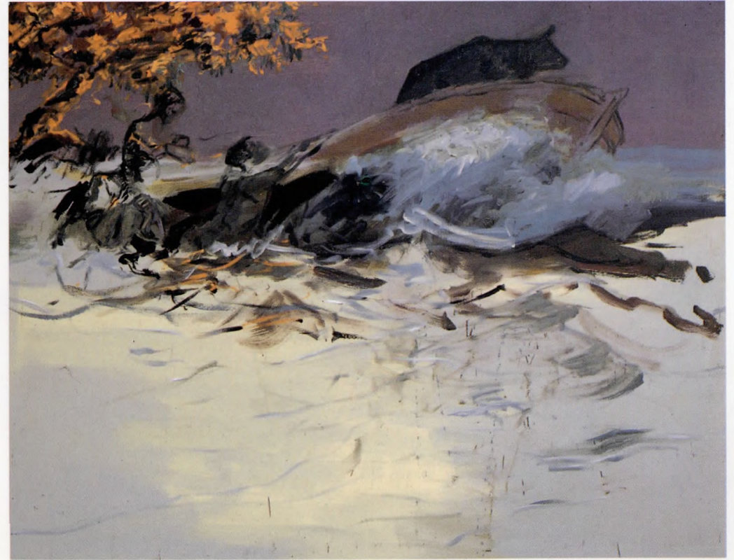
Kayık I Tuval üzerine yağlı boya 146x114 cm.

1966 Çağdaş Türk Ressamları Desen Sergisi 1971 Çağdaş Türk Resmi Karma Sergisi New York 1972 Sanat Bayramı, Yeni Eğilimler Sergisi İstanbul 1975 Arkeoloji Müzesi Açık Hava Sergisi İstanbul 1978 Çağdaş Türk Resim Sanatı Sergisi Moskova-Bakü S.S.C.B. 1978 Rijeka Uluslararası Çağdaş desen Sergisi 1980 Devlet Resim Sergisi 1981 Uluslararası 5. Cleveland Desen Sergisi 1983 18. Avrupa Sanat Sergisi 1986 Çağdaş Türk Plastik Sanatlar Sergisi 1986 Teşvikiye Sanat Galerisi İstanbul 1987 Tanbay Sanat Galerisi, Grup Sergisi Ankara 1988 Kayaalp Sanat Galerisi, Grup Sergisi İstanbul 1989 Destek Sanat Galerisi, Öğr. Üyeleri Karma Sergisi İstanbul 1989 "Türk Resiminde Ortak Bilinç" Karma Sergisi Yapı Kredi Kazım Taşkent İstanbul 1989 Urart Sanat Galerisi, Grup Sergisi Ankara