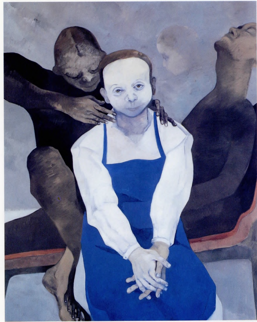
Ecinniler 1990 Tuval üzerine yağlı boya 180x 160 cm