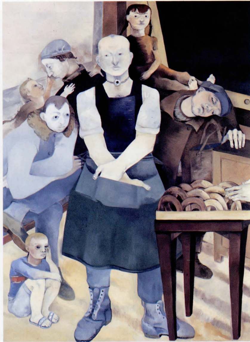
Gece vapuru 1990 Tuval üzerine yağlı boya 200x150 cm.