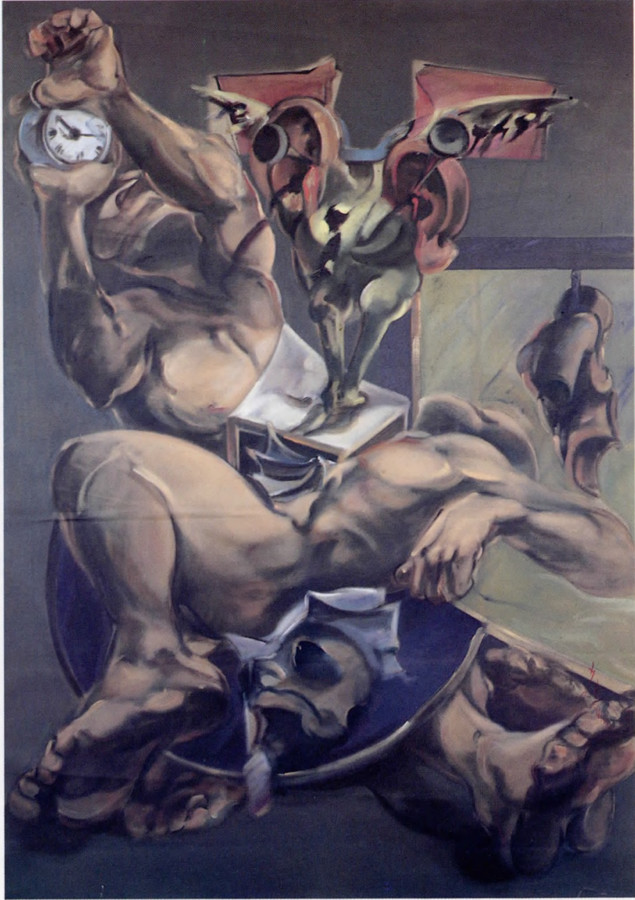
Barbarları beklerken Tuval üzerine yağlı boya 138x199 cm