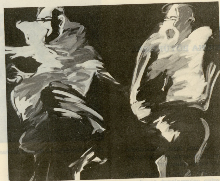
MUSTAFA ATA- "Küçük bir hikaye" 1987. Tuva üzerine yağlıboya 135x170 cm. (Başarı Ödülü.)

Yeni Eğilimler Sergisi'nin ödül dağıtım töreni 13 Ekim Salı günü saat 17.30'da Mimar Sinan Üniversitesi'nde yapılacak bir törenle kazanan sanatçılara verilecek. Sergi ise 6 Kasım Cuma akşamına kadar Osman Hamdi Bey salonunda devam edecek.