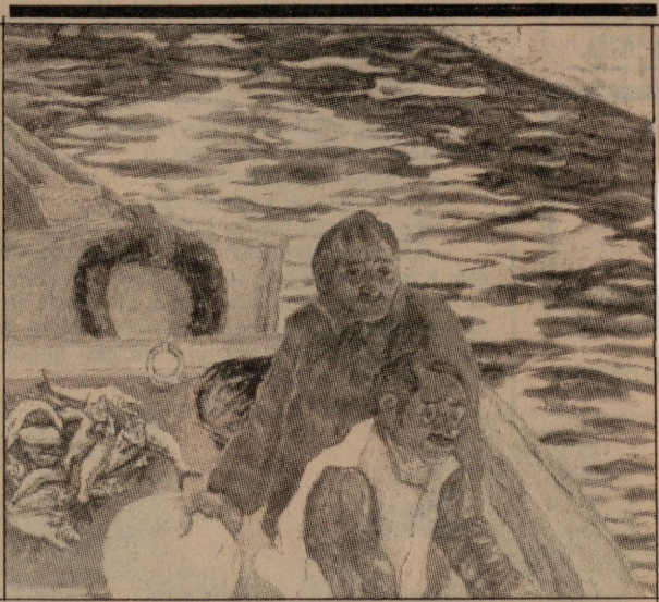
Özer Kabaş'ın "Rihim" adlı yapıtı.

"Bunalmıdan Yaşama Kültürü", aslında parçasız bölünsüz felsefenin daha çok "yaşama felsefesi" yöresinde yer almakta.