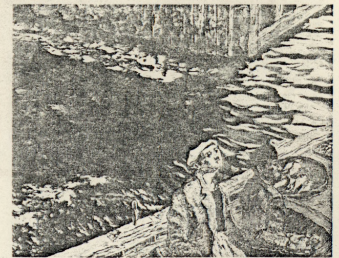
ÖZER KABAS — "Unutulmuş sular kaçamıs meseler" 1986. Tuval üzerine yağlıboya. 114x140 cm.