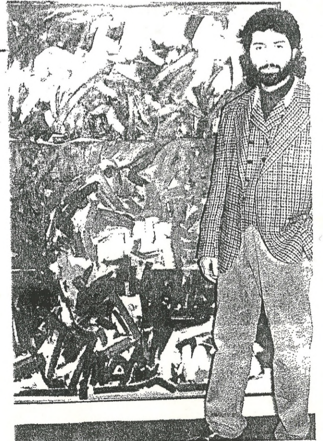
Kompozisyon-1989 Tural üzerine yağlıboya 170 x 120