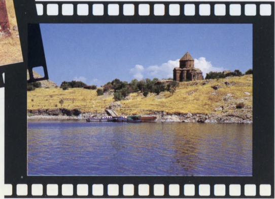
Ermeni Kilisesi, Akdamar Adası