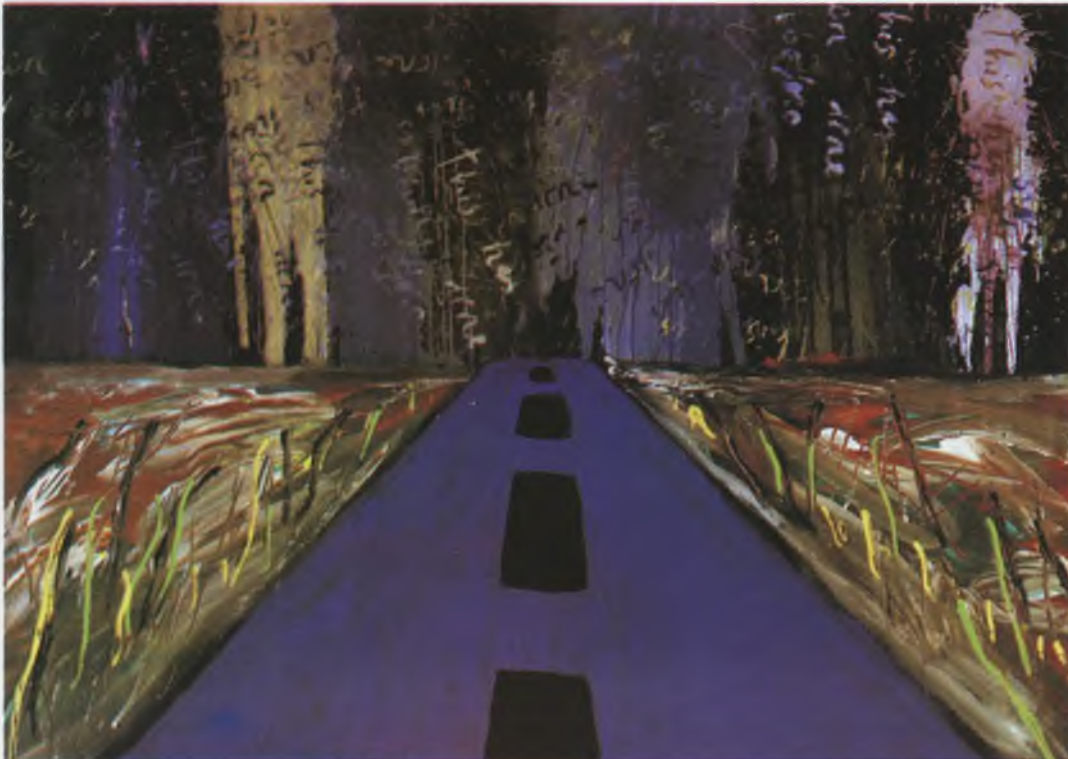
Bedri Baykam, This Has Been Done Before. Drip Series Leading Nowhere, 1991, 155x213 cm, Mixed media on canvas

Nur Koçak ise “Güney Sanayii/1978-1998” başlıklı işinde izleyiciyi sanayileşmiş bir kentin çarpık görüntüleriyle başbaşa bırakıyor. Belirtilen tarihler rasgele seçilmemiş. 1978, Türkiye’deki ekonomik ve siyasal buhranın doruğa çıktığı yıla işaret ediyor. 1998 ise bugünün kent kültürünü tanımlayan, görüntünün sabitlendiği tarih. Aradan geçen süre içinde Koçak’ın fo-