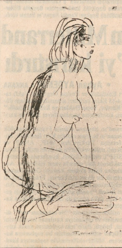
Fikret Mualla'nın bir kadın deseni.

Öte yandan, Fikret Mualla'nın tablolarının en çok taklit edilen tablolar olduğuna dikkati çeken resim uzmanları, Resim ve Heykel Müzesi'nde olduğu belirtilen orijinal tabloların uzmanlar tarafından kontrol edilmesi gerektiğini belirttiler.