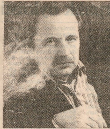
Che'nin arkadaşı Debray