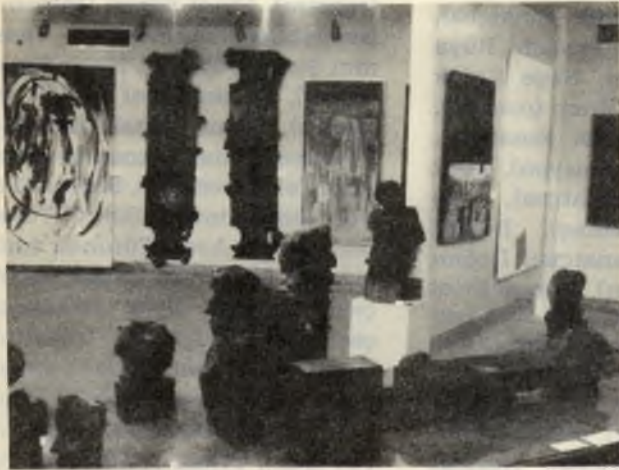
Bangladeşli sanatçıların yapıtları toplu halde...

"Barış ve Anlaşma İçin Sanat" adını taşıyan bu sergi, "sanatın anlamı ve barış, uyum ve anlaşma yolunda insanın istekleri ve varlığı ile ilişkileri" konusunda iki günlük bir seminerle tamamlandı. Serginin amacı, Asya ülkeleri arasında, kültür ve sanat iletişimini güçlendirmek, sanat alanındaki gelişmelerin yeni ve değişik bakış açılarının karşılıklı alışverişini yapmak, Asya ülkeleri sanatçıları arasındaki bağları güçlendirmektir.