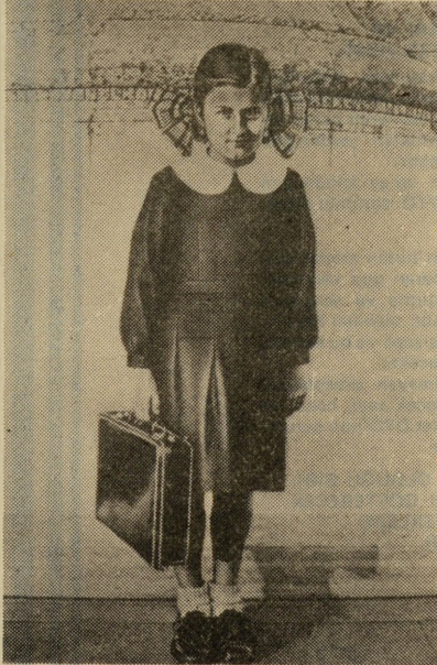
NUR KOÇAK — "Ablam, İlkokul 3. Sınıfı Başladığı Gün Taksim Anıtı Önünde" 1981. Kağıt/kurşun kalem 70x50 cm.

Beş kıtadan 48 ülkenin 459 sanatçısıyla yer aldığı atlasta ülkemizin tek temsilcisi ressam Nur Koçak.