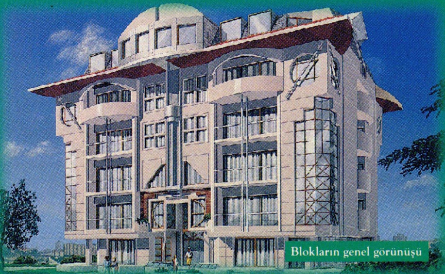
Blokların genel görünüşü

girilen yapılarımızın her katında sizi değişik beğeni ve ihtiyaçlara cevap verecek farklı daire tipleri bekliyor. Öyle ki stüdyo tipi daireleri tercih eden, bahçe ve göletle iç içe keyifli bir yaşam sürmek isteyenleri bile düşündük.