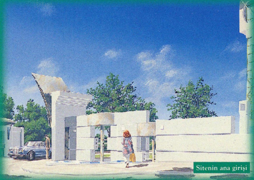
Sitenin ana girişi

Platin Konutları, artık soluk almanın bile güçleştiği İstanbul'da yeni bir nefes. İstanbul'un içinde daha modern, daha ayrıcalıklı bir yaşam biçimi. Bu ayrıcalıklı